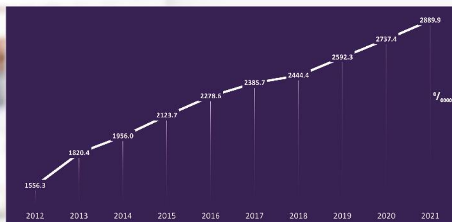
Prevalența (rate la 0 / 0000 de locuitori) tulburărilor mintale și de comportament (cod ICD 10 F00-F99), în România, în perioada 2012-2021 4

Prevalența tulburărilor mintale și de comportament în România a crescut constant în ultimii 10 ani, astfel de la valoarea de 1566,3 0 / 0000 de locuitori în anul 2012 a ajuns la o valoare aproape dublă de 2889,9 0 / 0000 de locuitori, în anul 2021.