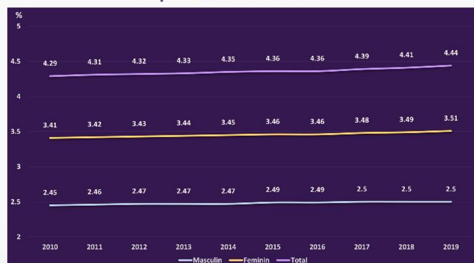
Prevalența depresiei (%) în România, pe genuri, în perioada 2010-2019 3

Prevalența tulburărilor mintale și de comportament în România a crescut constant în ultimii 10 ani, astfel de la valoarea de 1566,3 0 / 0000 de locuitori în anul 2012 a ajuns la o valoare aproape dublă de 2889,9 0 / 0000 de locuitori, în anul 2021.