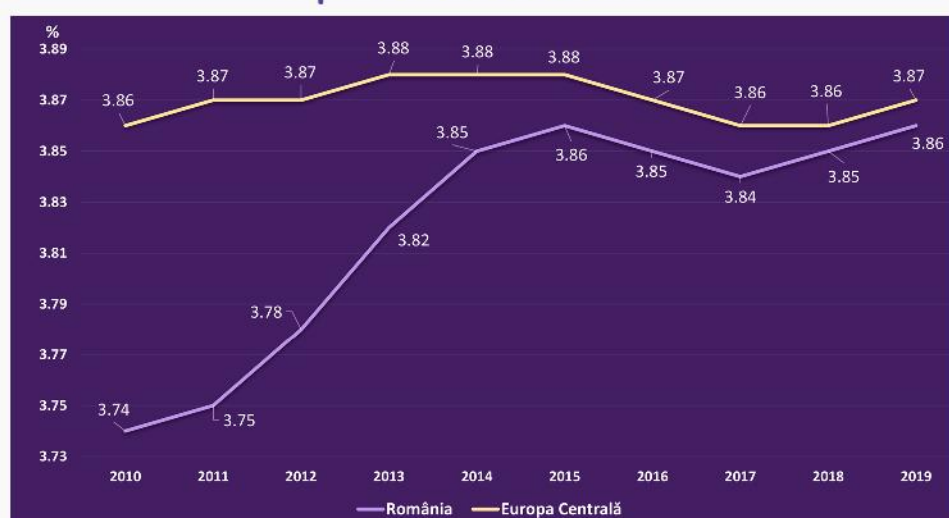
Prevalența anxietății % comparativ România-Europa Centrală, în perioada 2010-2019 3

În perioada 2010-2019, prevalența depresiei în România, pe genuri înregistrează un platou aproximativ, la femei aproape dublu față de bărbați.